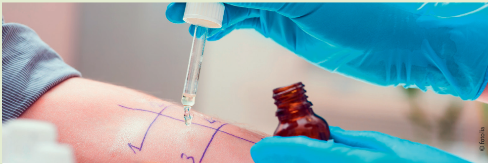
Lors de tests cutanés, on met des substances allergènes au contact de la peau. En cas d'allergie, une réaction cutanée apparaît.